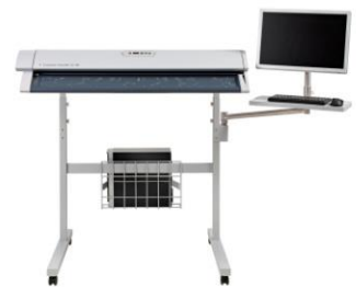
SC Xpress シリーズ専用 ユニバーサルスタンド