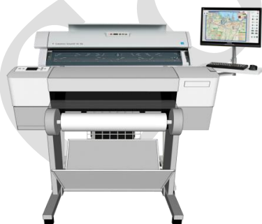
A1/A0 サイズ対応 MFP

※MFP システムのアップグレード価格は各スキャナ「導入後アップグレード価格表」の金額と同様です。