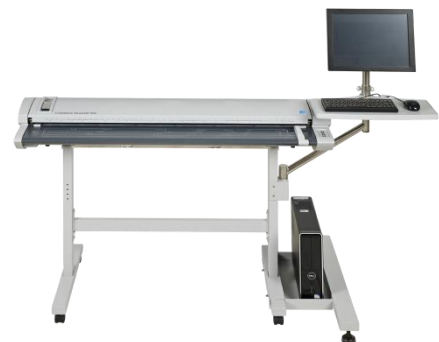
B0 サイズ対応プロフェッショナル MFP

※上記、写真内のパソコン、モニター、キーボード、マウス、プリンター等は MFP セットには含まれません。別途ご用意ください。